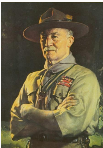
Robert Baden-Powell, de grondlegger van scouting (in uniform)

Het uniform bestaat uit een aantal eenvoudige stukken; het is speelkledij met plaats voor fantasie. "Bewegingskledij" is misschien een beter woord dan "uniform"; uitnodigender, creatiever, vriendelijker.